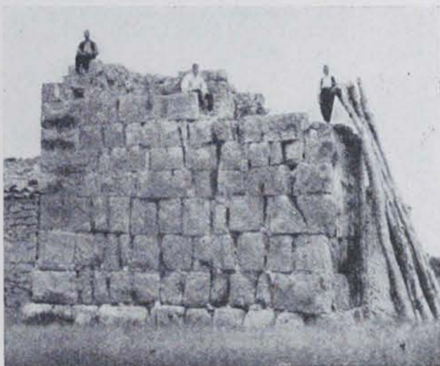
Fig. 130. — Vista de la Torre dels Moros, de Serós

entre la part superior de les terrasses i l'arenys del riu i terres de regadiu properes a aquest, les terrasses, dedicades a conreus de secà, són completament planes. Gairebé a l'aresta de la terrassa de la riva dreta del Segre s'aixeca la Torre dels Moros.